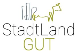
Startup-Unternehmen StadtLandGut – Firmenevents auf dem Bauernhof

Das Kollektiv hat sich zusammengetan, um gemeinsam mehr Sichtbarkeit zu erreichen, sowie die Vernetzung von Selbständigen Frauen zu fördern und alte Klischees zu verabschieden. Frei nach dem Motto „be better together“!